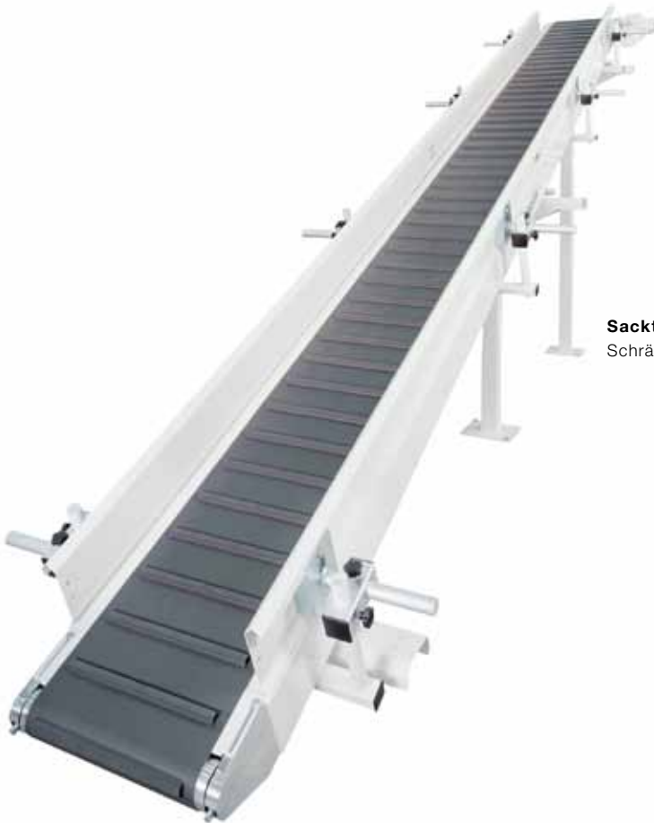
Sacktransportband MWTK – auch für Schrägförderung bis 25°.