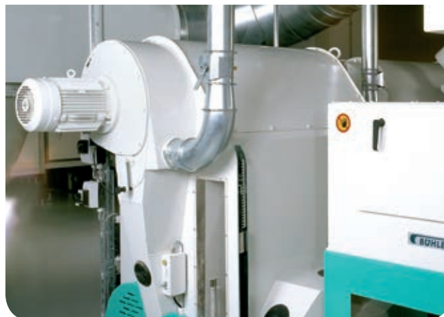
Canal de aspiración MVSQ: separación perfecta de los fragmentos desprendidos.