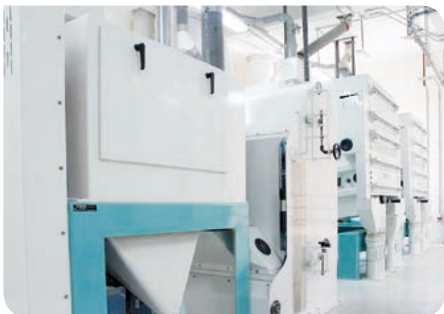
Excelente efecto abrasivo. MHXS con canal de aspiración MVSQ.