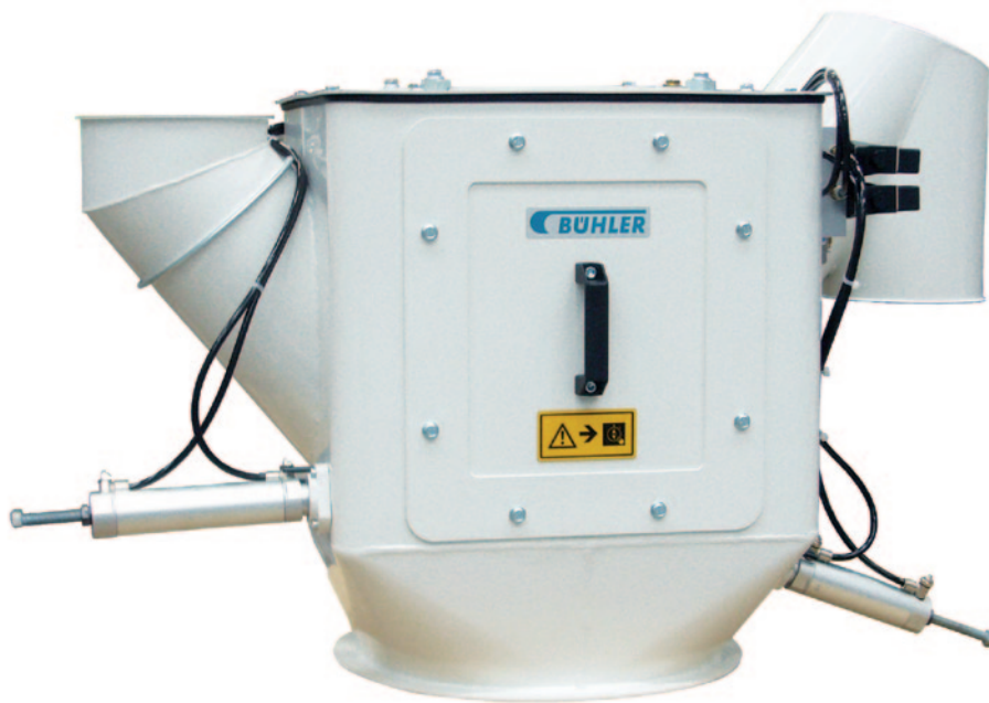
Doppelschieberspeisung MWSU Präzise Dosierung.